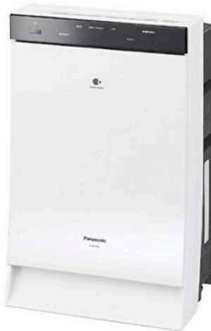
画像をクリックして拡大イメージを表示

パナソニック PM2.5対応加湿空気清浄機 (空清31畳まで/加湿19畳まで ホワイト) Panasonic nanoe (ナノイー)・ECONAVI (エコナビ) 搭載 F-VXL70の限定モデル F-VC70XL-W